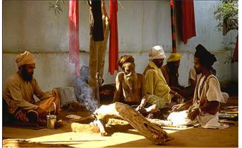
Una tranquila escena matutina de los Udasin Babas alrededor del dhuni , reunidos para la celebración anual de Śivaratri .

La secta principal de los ascetas Udasin no era originalmente Śaiva -- ni incluso hindú -- sino que pertenecía a la religión Sikh . Fue fundada en el siglo XVI por un hijo del Guru Nanak -- el fundador del Sikhismo -- llamado Sṛcandra . Los Udasin por lo tanto se conocen también como Nanakputras , “los hijos de Nanak ”, y veneran el Grantha Saheb , el libro sagrado de los Sikhs . Fueron excomulgados por el sucesor del Guru Nanak y gradualmente acabaron convirtiéndose al Hinduismo.